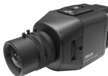
(ЗАДНЯЯ КРЫШКА СНЯТА)