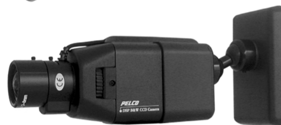
ТЕЛЕКАМЕРА УСТАНОВЛИВАЕТСЯ НА УЗЛЕ КРЕПЛЕНИЯ РСМ100